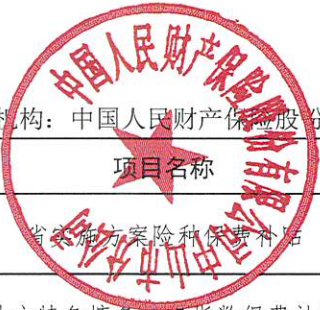
2025年二季度中山市政策性农业保险承保和财政保费补贴情况表

承保机构：中国人民财产保险股份有限公司中山市分公司 日期：2025年7月31日 单位：元